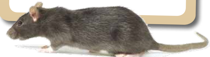
Alja Willenpart Društvo za zaščito živali Ljubljana, www.dzzz.si