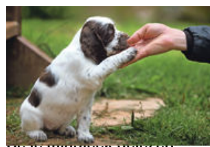
Če je mladiček doživel pravilne vzgoje, bo odrasel v prijetnega psa.

spoznavanje novega okolja. Predvsem na začetku je potrebnega veliko prilagajanja in odrekanja. Upoštevati morajo, da je menjava doma za takega psa zelo stresna in se v