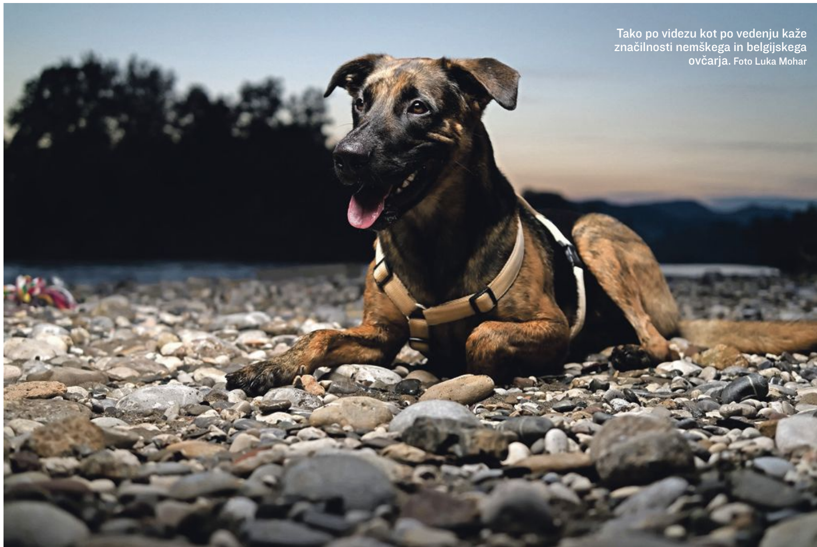
Tako po videzu kot po vedenju kaže značilnosti nemškega in belgijskega ovčarja.