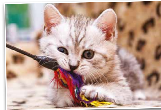
FOTOGRAFIJA: PASJI DVOREC